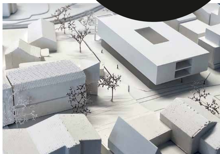
© ARGE Studio Lois & Iris Reiter

Die Arbeitsgemeinschaft „Studio Lois & Iris Reiter Architektur“ planen den Neubau der Volksschule Kirchplatz. Die beiden Büros sind als Erstgereichte aus dem Generalplaner-Verhandlungsverfahren hervorgegangen. Ihr Entwurf überzeugte die Jury, die u.a. von der Schuldirektorin beraten wurde. Der Gemeinderat erteilte ihnen in der Sitzung vom 11. Mai den Auftrag. Das Siegerprojekt und weitere Entwürfe werden bei einer öffentlichen Ausstellung vorgestellt werden. Baubeginn ist für Anfang 2024 geplant. Aktuelle Informationen zum Ausweichquartier während der Bauzeit wurden den Eltern bei einem Termin Ende Mai mitgeteilt.