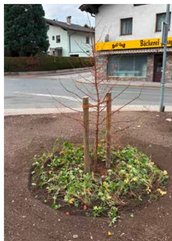
Die Gemeindegärtnerei pflanzte neue Bäume am Sportplatz (l.), an der Bahnhofstraße (m.) und am Marienplatz (o.)