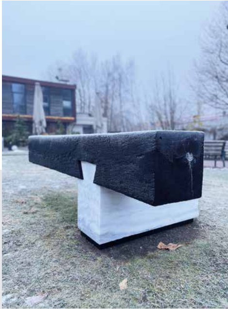
Die Skulptur „Fuck Off Light“ von Klemens Cervenka widmet sich Licht und Dunkelheit